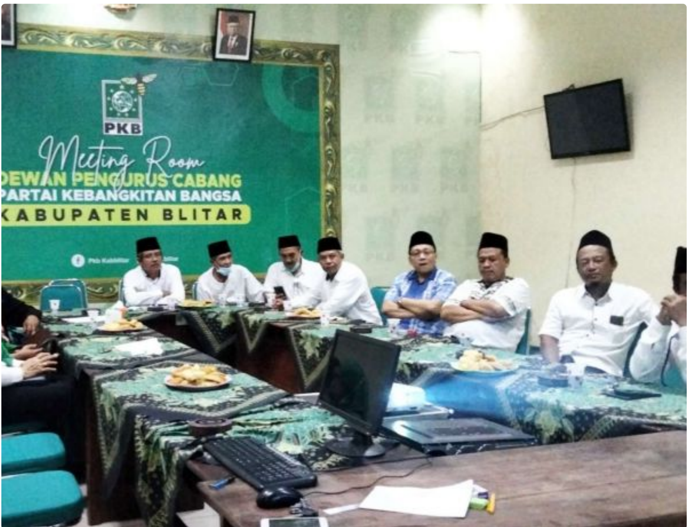
Acara Live Streaming DPC PKB Kabupaten Blitar dengan DPW PKB Jawa Timur

BLITAR - Istighosah malam hari ini dalam rangka Peringatan Harlah NU Ke 98 Tahun Hijriyah yang di adakan oleh Dewan Pimpinan Wilayah (DPW) Partai Kebangkitan Bangsa (PKB) Jawa Timur. Dengan tujuan untuk mendoakan