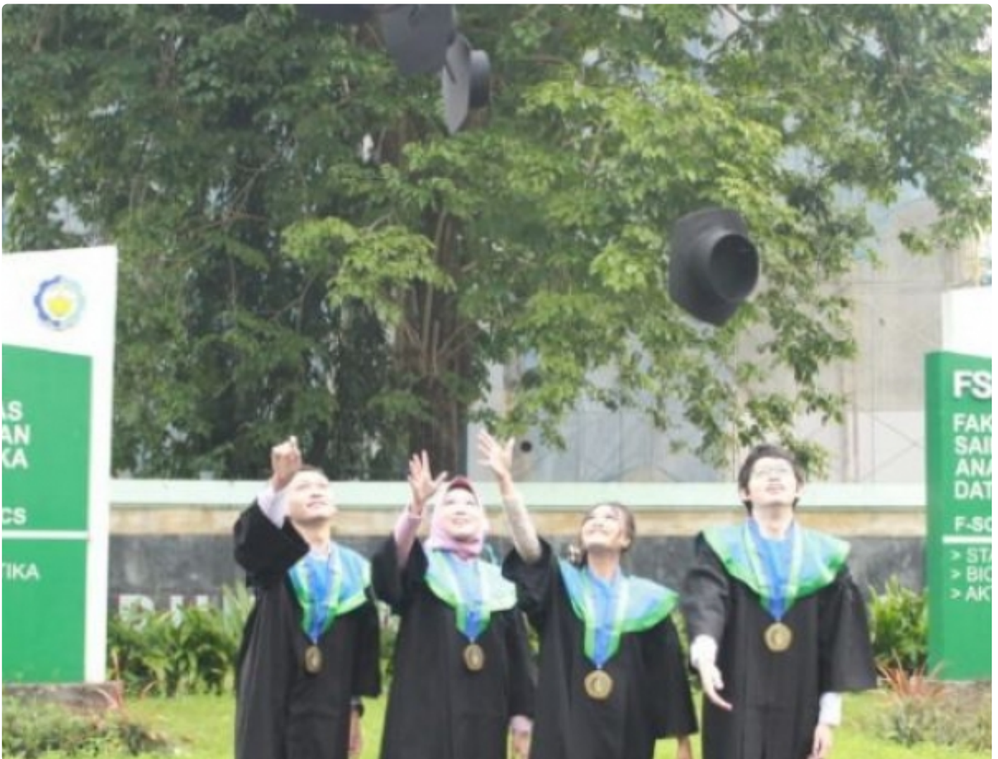
Ke empat wisudawan angkatan pertama Departemen Aktuaria ITS di depan Menara Sains, Sabtu (26/3)

SURABAYA – Departemen Aktuaria Institut Teknologi Sepuluh Nopember (ITS) yang resmi didirikan pada 2018 lalu telah meluluskan talenta-talenta terbaiknya untuk pertama kali. Aktuaria ITS telah meluluskan empat mahasiswa angkatan pertamanya pada Wisuda ke-125 yang diselenggarakan, Sabtu (26/3/2022).