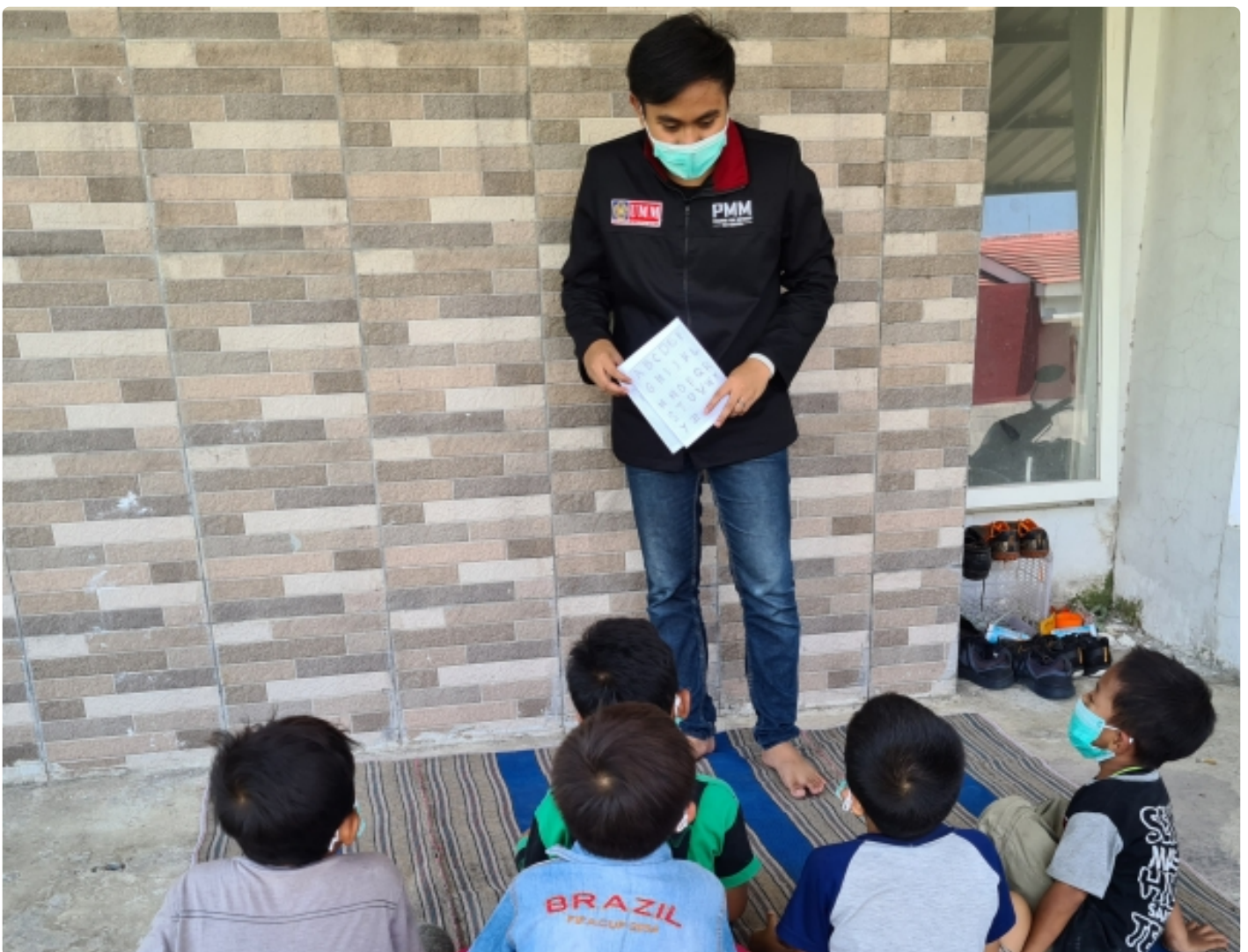
Mahasiswa UMM Pada saat melaksanakan program PMM Bhaktimu Negeri

MALANG - Ditengah terhentinya proses belajar mengajar disekolah, Mahasiswa Universitas Muhammadiyah Malang melaksanakan kegiatan Pengabdian Masyarakat oleh Mahasiswa (PMM) Bhaktimu Negeri di Desa Jambuwok,